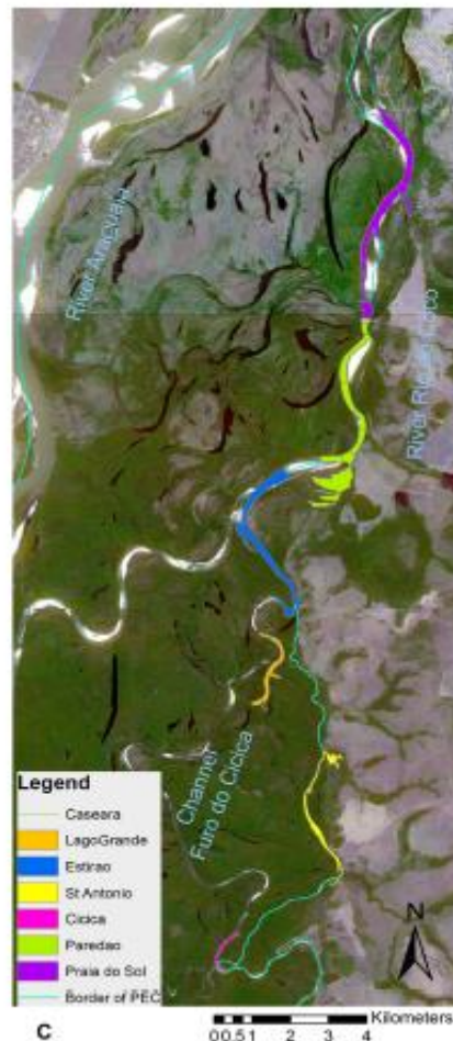
Figura 2- Locais onde foram realizadas as contagens de botos

As seções pesquisadas correspondem a todos os lagos e trechos de canal onde permaneceram botos durante a estação seca no quadrante nordeste do PEC. Dessa forma, os resultados servirão de base para o monitoramento permanente da população de botos nesse setor, que corresponde a aproximadamente 20% da área total do parque.