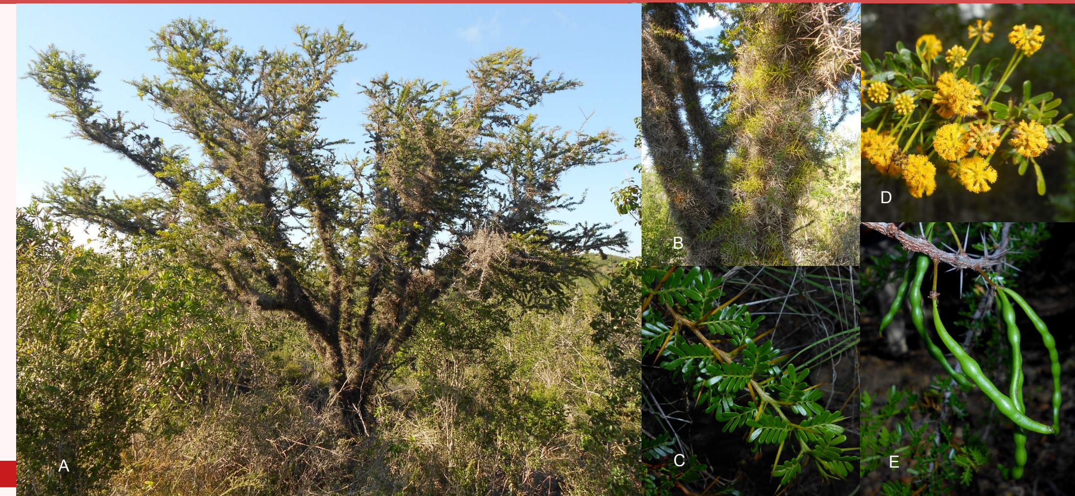
Figura 1. Acacia belairioides . A: Individuo adulto en su hábitat, B: Tronco espinoso, C: Rama con hojas, D: inflorescencias, E: Legumbres

Entre las principales amenazas que afectan el hábitat de Acacia belairioides se encuentran el manejo forestal inadecuado, la tala directa de los individuos adultos, los incendios y la invasión por especies exóticas, como el marabú ( Dricostachys cinerea (L.) Wright et Arn.) (Gómez et al. , 2015). La reciente delimitación de dos áreas protegidas (Reserva Florística Manejada Ceja de Melones y Reserva Natural Cerro Galano), que incluyen buena parte del rango de distribución de Acacia belairioides es una fortaleza importante para la conservación de esta especie, por lo que es necesario profundizar en el conocimiento de los rasgos claves de su historia de vida. En ese sentido, el presente proyecto contribuye a la conservación de este árbol amenazado, mediante la caracterización de la estructura del hábitat, la determinación del patrón de arreglo espacial de los individuos, la estimación del tamaño y estructura poblacional, la caracterización de los rasgos seminales, la evaluación de la germinación y determinación del efecto de los brúquidos depredadores de semillas sobre la germinación, así como la caracterización de los micrositios de establecimiento de las plántulas. Esta información se utilizó como punto de partida para el diseño e implementación de un plan de recuperación de la especie en las áreas protegidas donde crece, el cual contempló la capacitación al personal técnico, el establecimiento de un vivero y el reforzamiento poblacional en una de las localidades trabajadas.