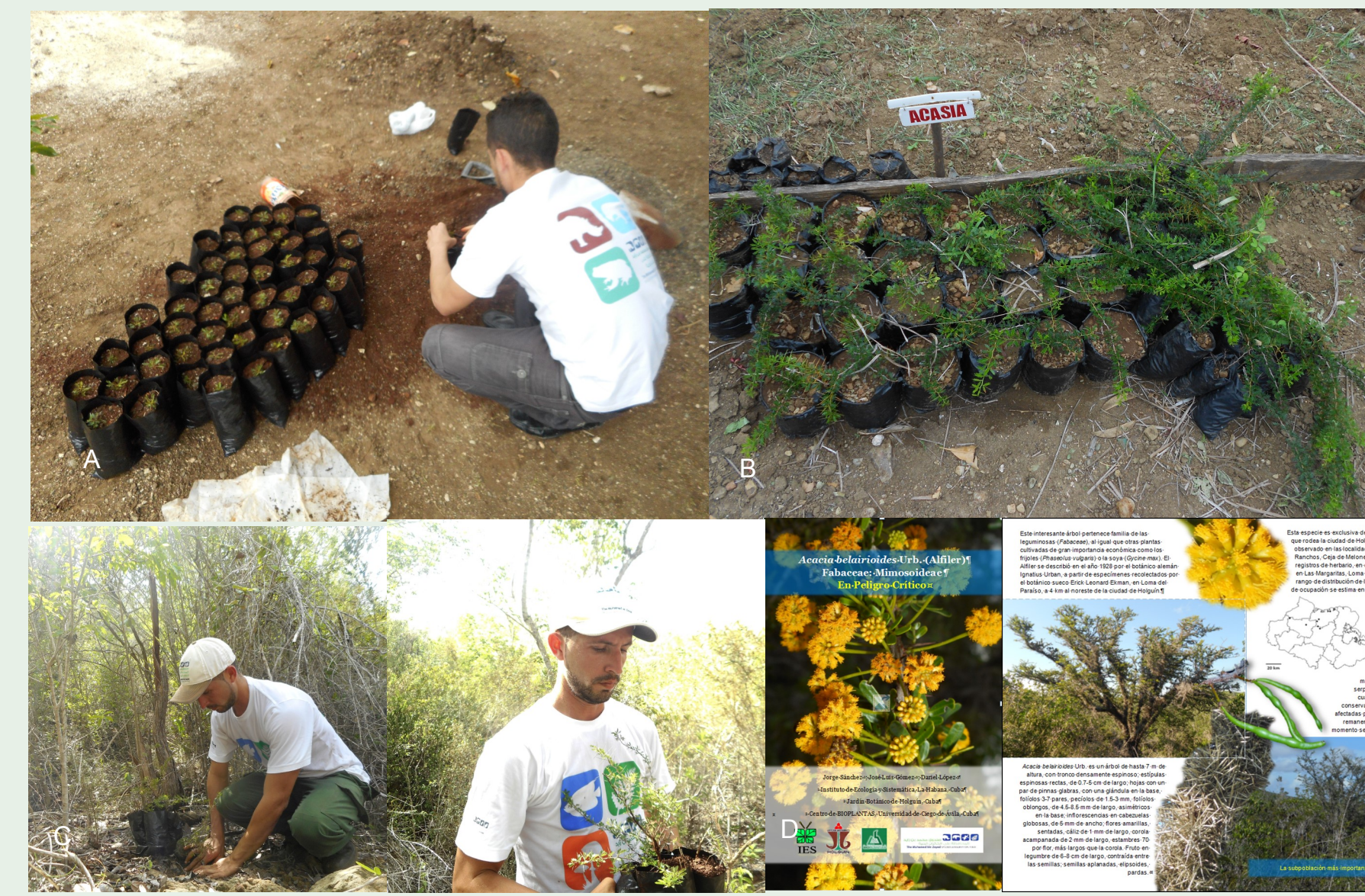
Figura 6. Principales acciones de conservación contempladas en el plan de recuperación de Acacia belairioides llevadas a cabo por el proyecto. A y B: Establecimiento de un vivero; C: Reforzamiento poblacional. D: Diseño e impresión de materiales divulgativos para la capacitación y educación ambiental