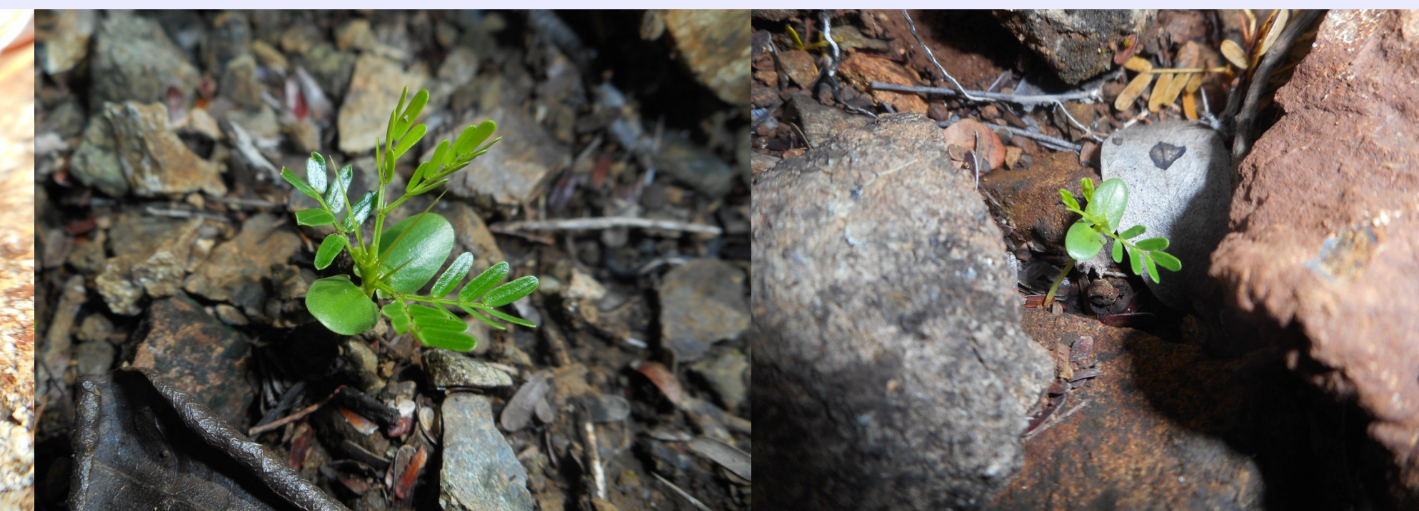
Figura 5. Las irregularidades en el suelo cercanas a los adultos coespecíficos favorecen el establecimiento de las plántulas de Acacia belairioides

A partir de estos resultados se infiere que los micrositios cercanos a los individuos adultos, con alta rocosidad, pendientes suaves (5-13°) y un pH promedio de 5.9, favorecen la regeneración in situ de Acacia belairioides . Es probable que la regeneración de la especie esté fuertemente limitada por la dispersión de las semillas, lo que explicaría por qué no se encontraron plántulas a más de 7 m de los parentales potenciales. Si bien no se encontraron diferencias en la cobertura arbustiva y herbácea entre micrositios ocupados y no ocupados, no se descarta que la supervivencia de la progenie sea mayor en sitios cubiertos por vegetación, dadas las condiciones extremas de los claros en los matorrales serpentinícolas (Gómez et al. 2013).