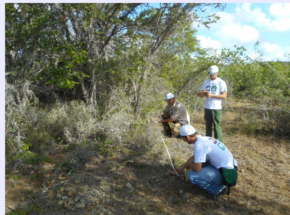
Figura 2. Estructura poblacional de Acacia belairioides en las localidades estudiadas

En total estimamos que la población de Acacia belairioides en las serpentinitas de Holguín tiene una extensión de presencia de 19 370 ha (193.7 km 2 ). El área de ocupación de las subpoblaciones estudiadas fue de 232.65 ha (2.32 km 2 ), con un tamaño efectivo de 490 individuos adultos, para una densidad de 2.1 adultos/ha. Del área de ocupación estimada, el 99.5% se encuentra dentro de los límites de las áreas protegidas Reserva Natural Cerro Galano (25.3%) y Reserva Florística Manejada Ceja de Melones (74.6%).