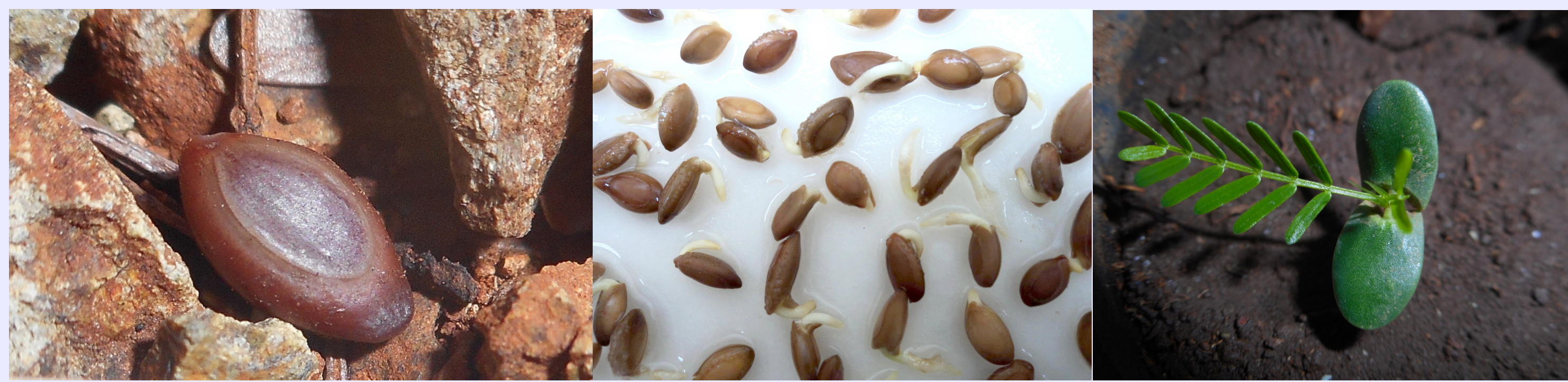
Figura 3. Las semillas de Acacia belairioides presentan dormancia física debido a su dura cubierta, por lo que deben ser sometidas a escarificación ácida para acelerar la germinación

Las semillas de Acacia belairioides presentaron dormancia física (Figura 3). Este rasgo seminal se comprobó mediante un tratamiento pregerminativo con ácido sulfúrico concentrado, posterior al cual se obtuvo un 95% de germinación final, que fue muy superior al 8% de germinación de las semillas intactas. La germinación ocurrió tanto a la luz como en la oscuridad, por lo que las semillas fueron consideradas fotoblásticas indiferentes, por tanto, pueden germinar en la superficie del suelo y debajo de esta. El rango óptimo de germinación varió de 25/30 °C hasta 25/35 °C, por su parte, el rango de temperatura alternante de 25/40 °C resultó subletal para la germinación y el rango de 25/45 °C fue letal.