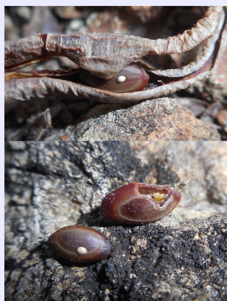
Figura 4. Signos de infestación por brúquidos en las semillas de Acacia belairioides