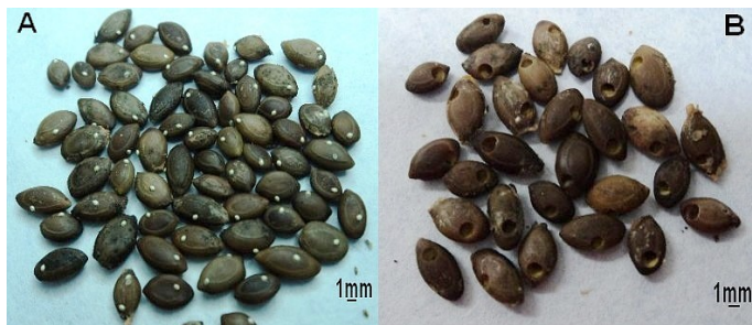
Figura 1. Semillas de Acacia belairioides con huevos (A) y hoyos en la cubierta seminal (B) por la actividad de los brúquidos.

Se identificaron dos especies de brúquidos (Coleoptera: Chrysomelidae: Bruchinae) como depredadoras de semillas de A. belairioides , una perteneciente al género Stator ( S. bottimeri Kingsolver) y otra del género Sennius ( S. fallax Boheman). De las 2500 semillas analizadas, 812 (32.5%) estuvieron infestadas por los brúquidos. De ellas, 427 (52.6%) mostraron huevos depositados en la superficie de la cubierta seminal y 384 (47.4%) presentaron hoyos u opérculos de emergencia del adulto (Fig. 1). En la mayoría de las semillas infestadas predominó la presencia de un huevo, o bien un hoyo por semilla (96.2% y 93.5%, respectivamente). La longitud de las semillas infestadas presentó una variabilidad de 7.7 a 4.3 mm y un valor promedio de 5.4 mm (Fig. 2) y su frecuencia de distribución no mostró diferencia significativa de una distribución normal ( \chi^2 = 12.5 ; P > 0.05 ).