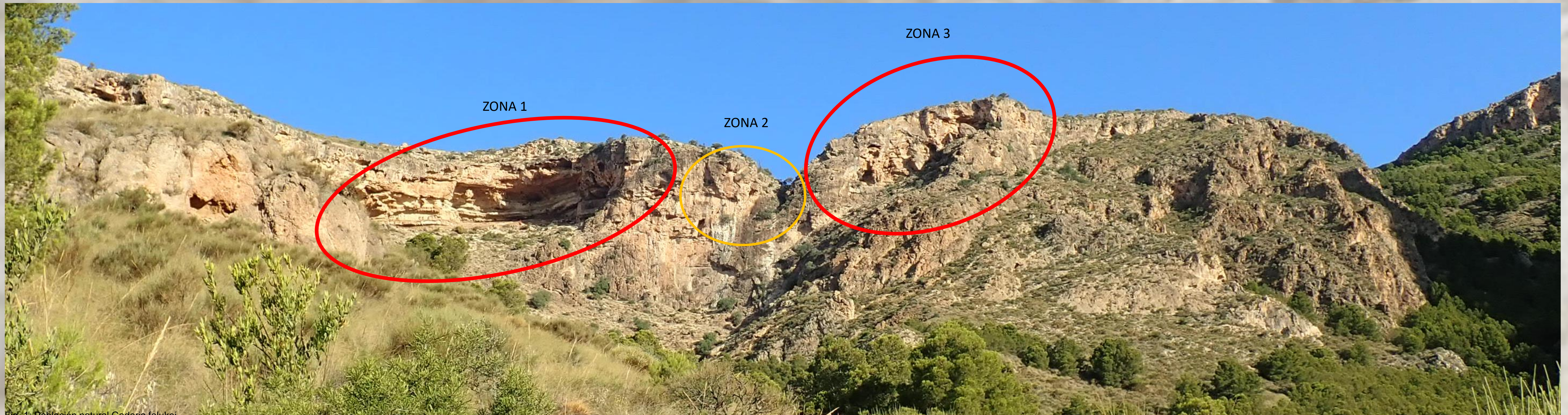
Fig. 1. Población natural Gadoria falukei