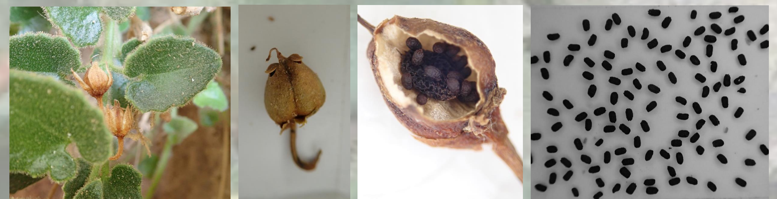
Tabla 1: Resultados de los tratamientos polínicos realizados en las plantas cultivadas

En las plantas cultivadas sí que se han podido realizar cruzamientos manuales, así que se han llevado a cabo los tratamientos de xenogamia, geitonogamia, autogamia y polinización espontánea.